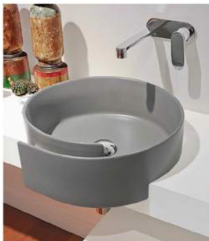
Roll 44 _ Grigio Lava art. RL44S - ø 44 x h 12,5/17 cm

Like a Japanese haiku, in a few strokes this washbasin sums up the evocative power of a poetic image. A simple rolled sheet marks the outline of an enveloping brim that confines running water imitating its dynamic flow. The line comprises two bench washbasins, two semi built-in washbasins and a free standing version that continues the profile of the washbasin down to the floor, and takes on monolithic proportions with a striking visual impact.