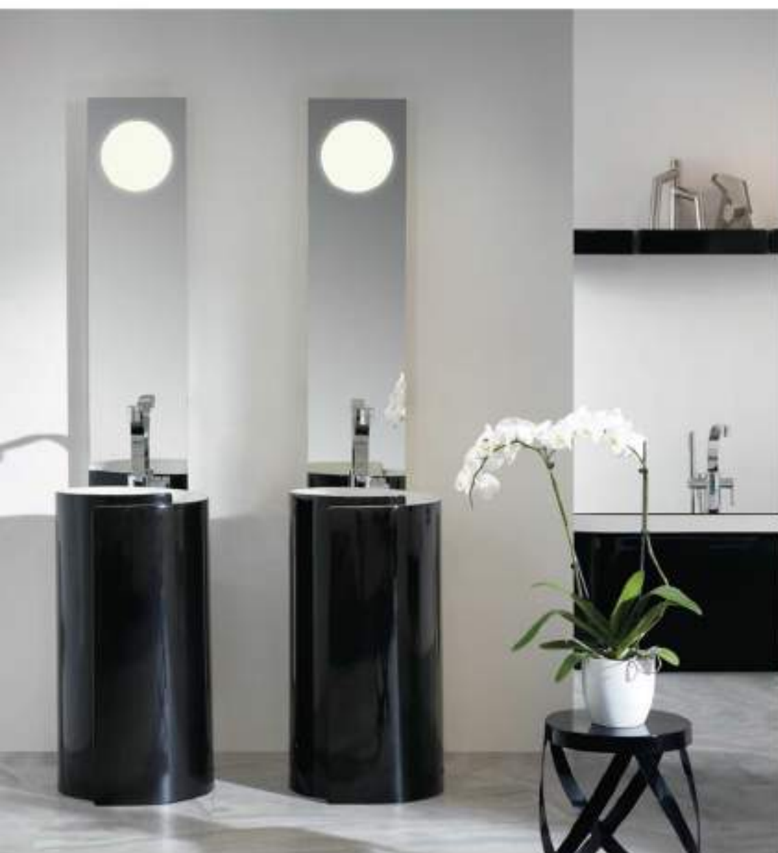
Monoroll Bicolor MR44C - ø 44 x h 85 cm