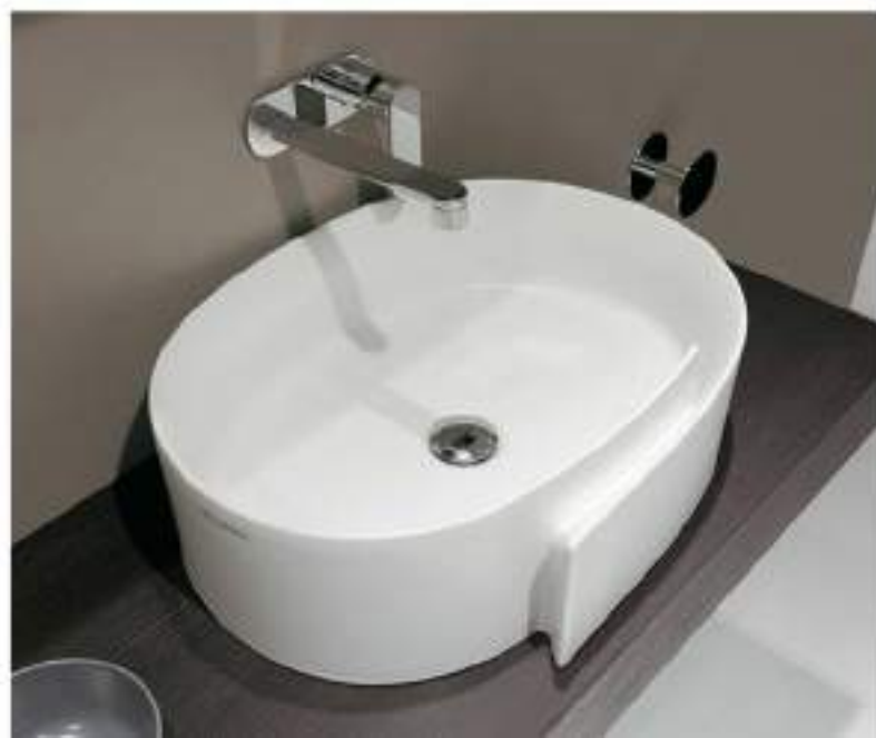
Roll 56 _ Latte art. RL56L - 56 x 42 x h 17 cm