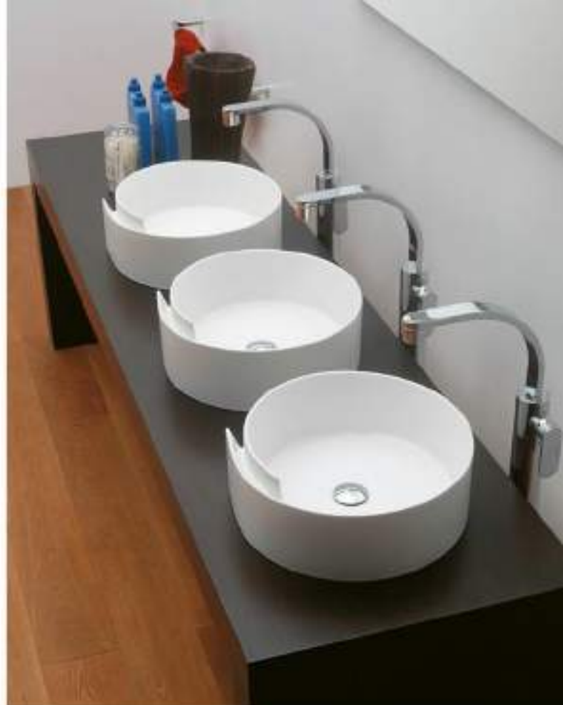
Roll 44 art. RL44L - ø 44 x h 17 cm